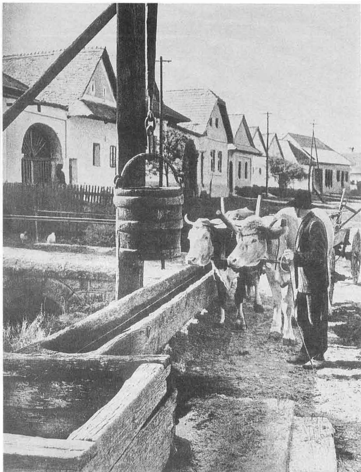
1. Pohľad na hlavnú ulicu Dobrej Nivy (okr. Zvolen) so studňou ako zdrojom vody, napájadlom i komunikačným centrom. 1948