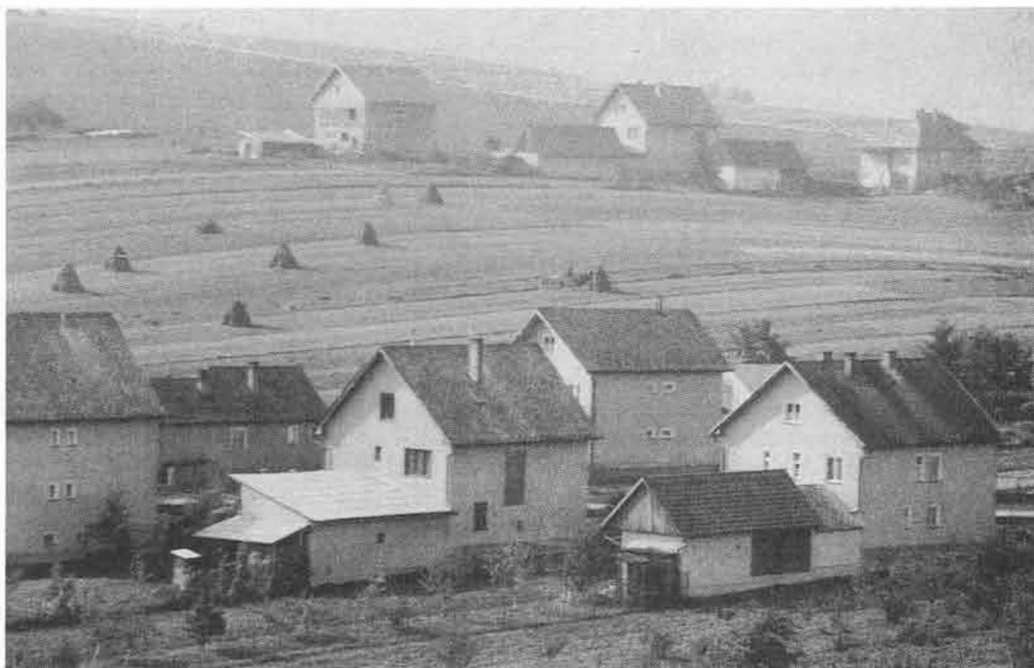
Domy na ulici Roveň. Sliache, okr. Lipt. Mikuláš. 1988