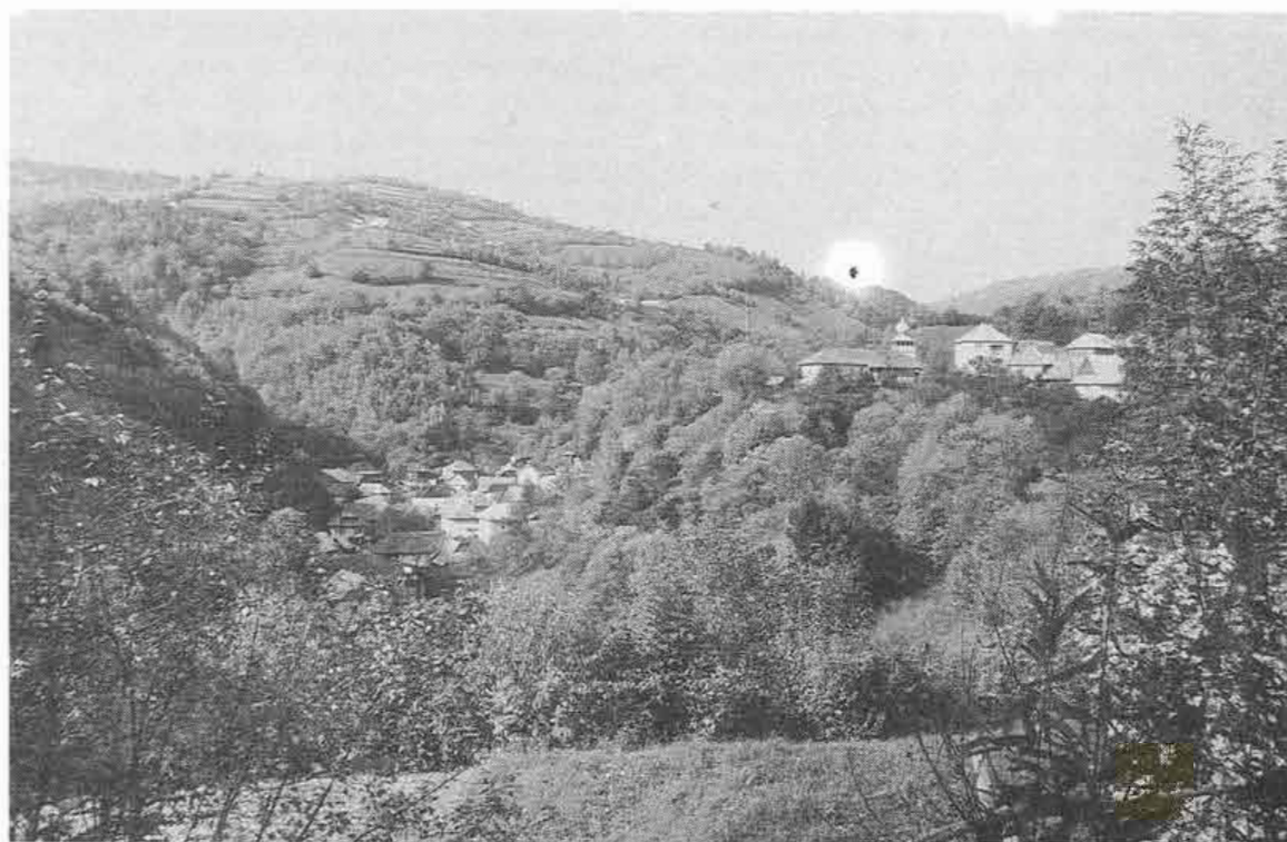
Pohľad na obec Muránska Zdychava, okr. Rožňava. Foto J. Podoba 1988