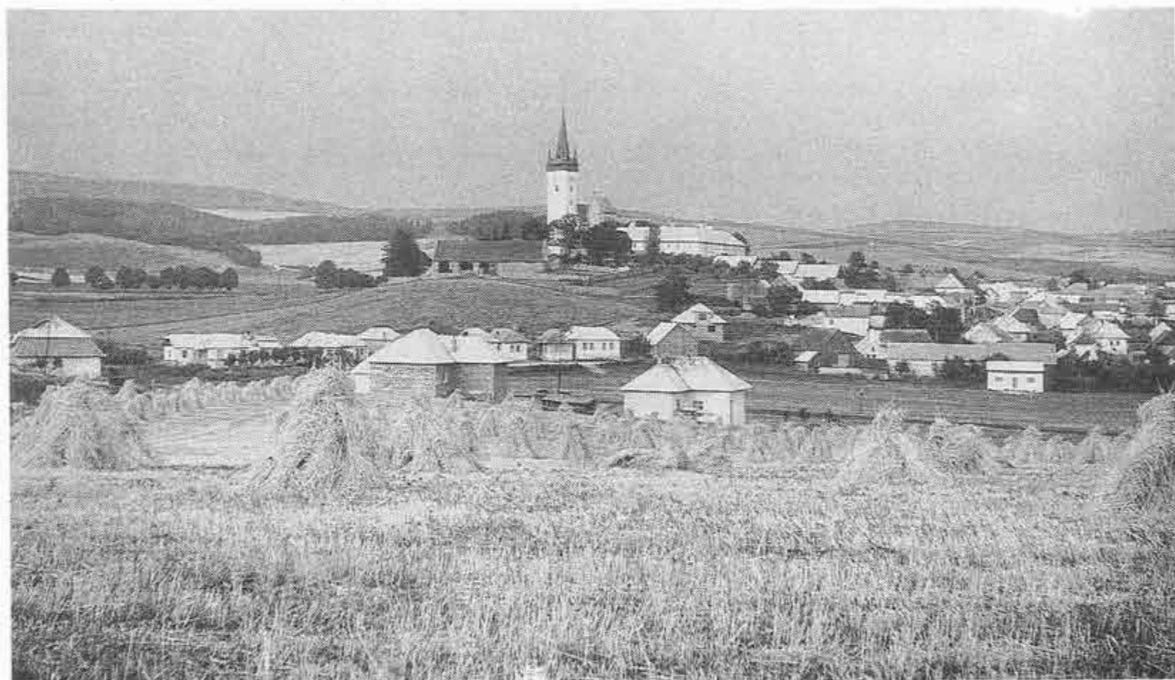
Pohľad na Spišský Štvrtok s poľnohospodárskou krajinou. Foto O. Nehera 1960