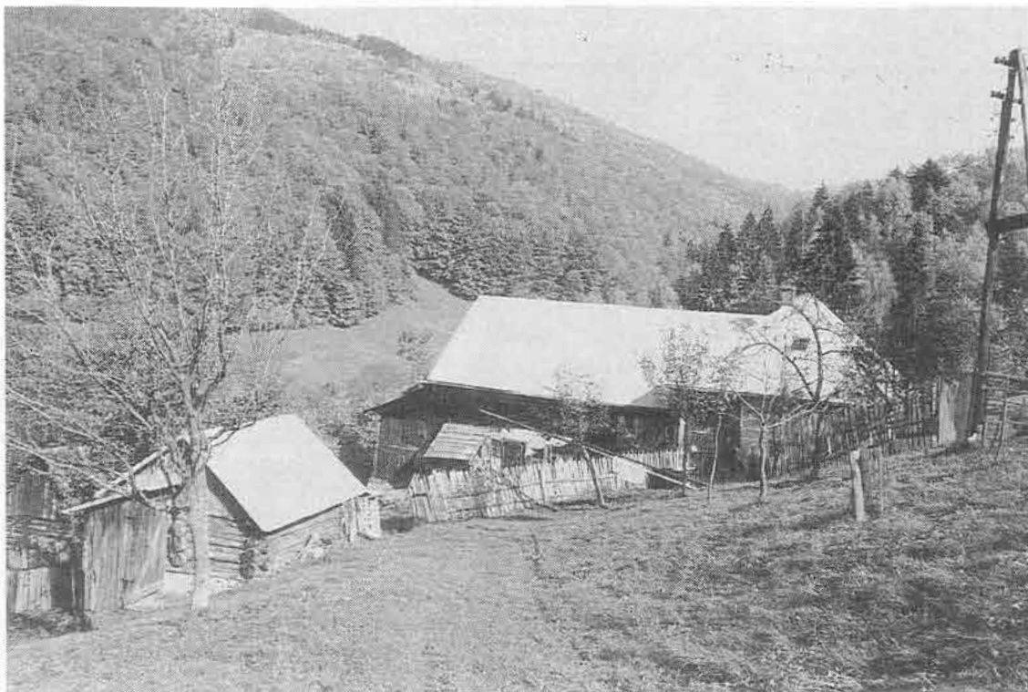
Muránska Zdychava (okr. Rožňava) - usadlosť z 50. rokov. Foto J. Podoba 1988