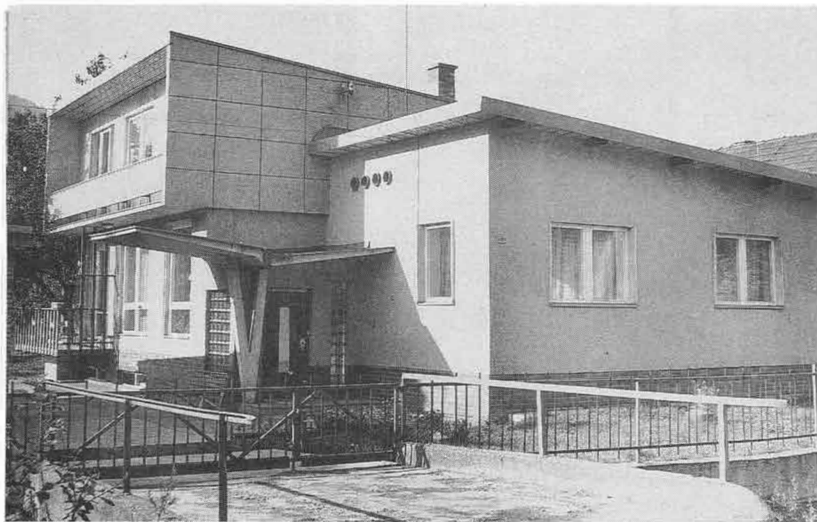
Restavba domu z r. 1927 urobená r. 1964 v Likavke, okr. Lipt. Mikuláš.