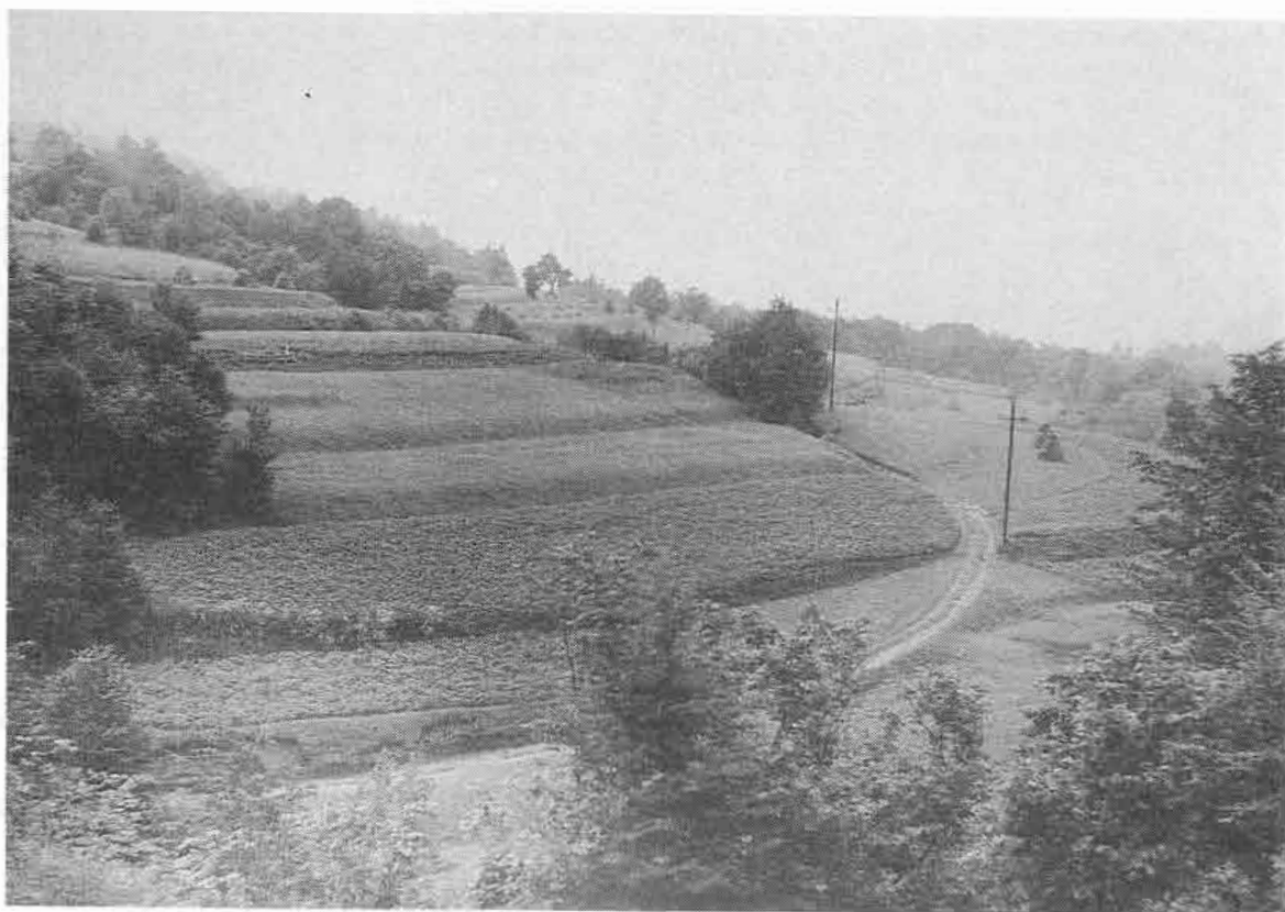
Poľnohospodárska krajina pri ceste na Markovo. Muránska Zdychava, Rožňava. Foto J. Podoba 1988