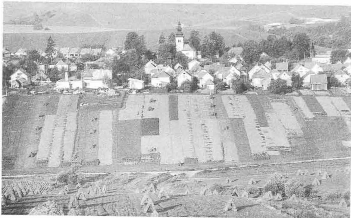
Pohľad na obec Stredný Sliach (okr. Liptovský Mikuláš) s kultivovanou poľnohospodárskou krajinou. Foto J. Podoba 1988