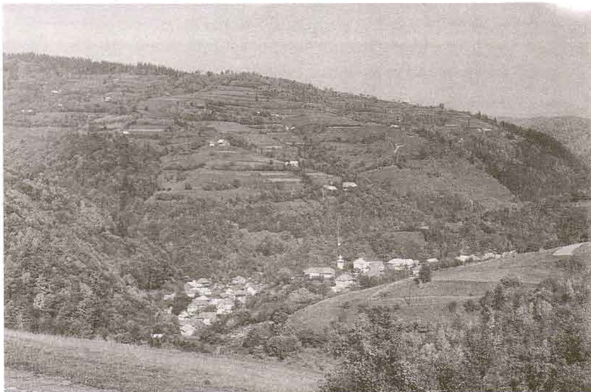
Pohľad na obec Muránska Zdychava, okr. Rožňava. Foto J. Podoba 1988