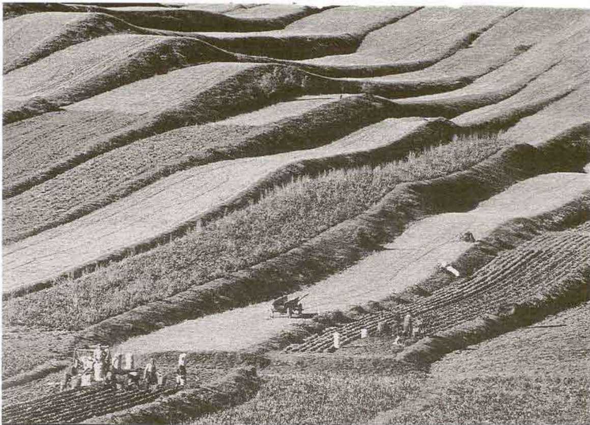
Tradičné využívanie poľnohospodárskej pôdy na Slovensku.

prístupmi. Multidisciplinárny charakter ekológie len dosvedčuje nevyhnutnosť mnohoaspektového rozpracovania tejto problematiky, ktoré umožňujú ekológii i ostatné vedné disciplíny, nejakým podielom participujúce na riešení otázok spojených s poznátnym procesom, pozitívne či negatívne ovplyvňujúcich životné prostredie. 3