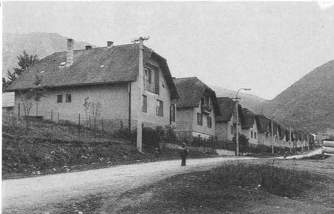
"Májová" ulica postavená po r. 1945 v Stráňanoch (okr. Žilina).