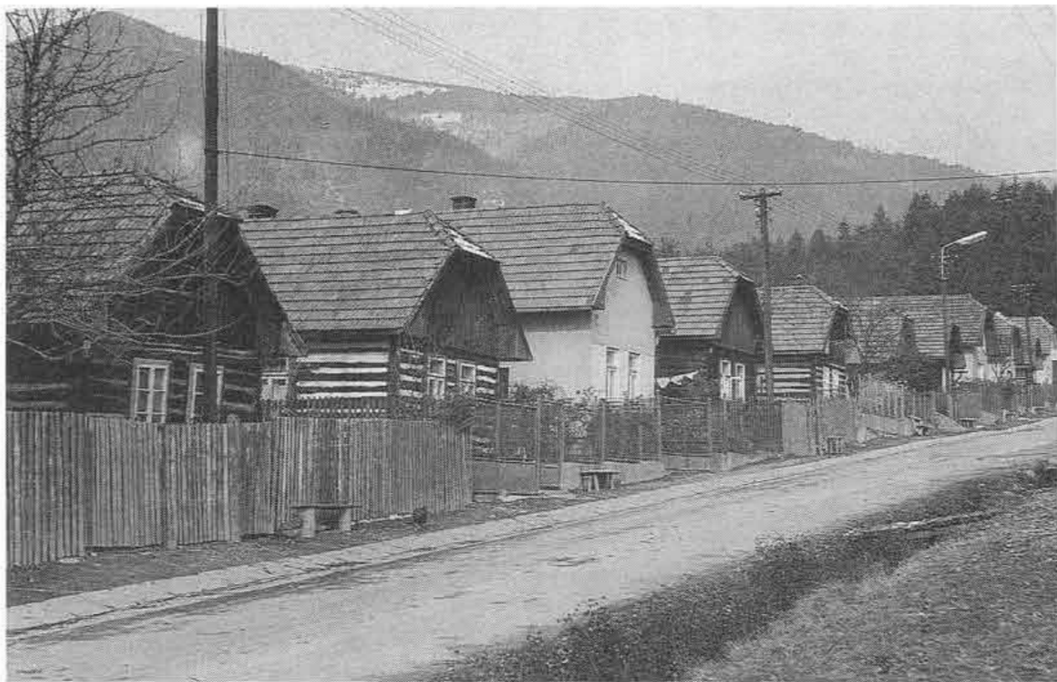
Staršie obytné domy v osade Lásky. Bystrička, okr. Martin.