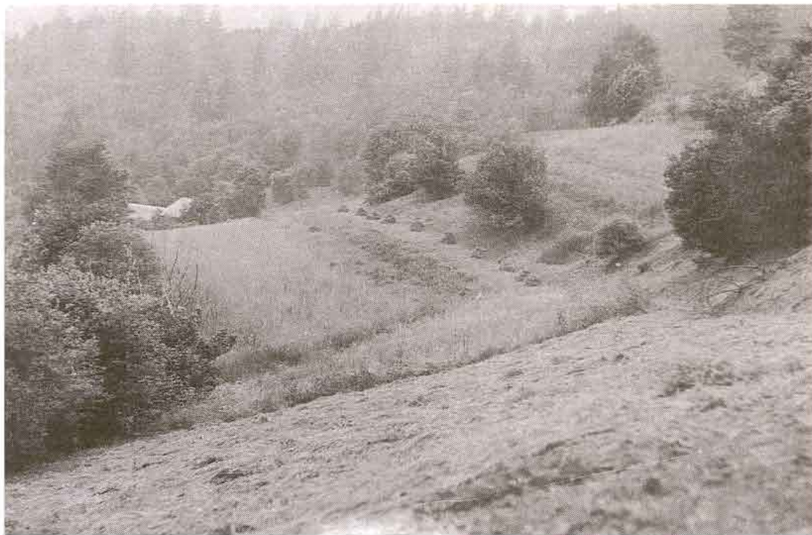
Pol'nohospodárska krajina na Krivých zemiach, Muránska Zdychava, okr. Rožňava. Foto J. Podoba 1988