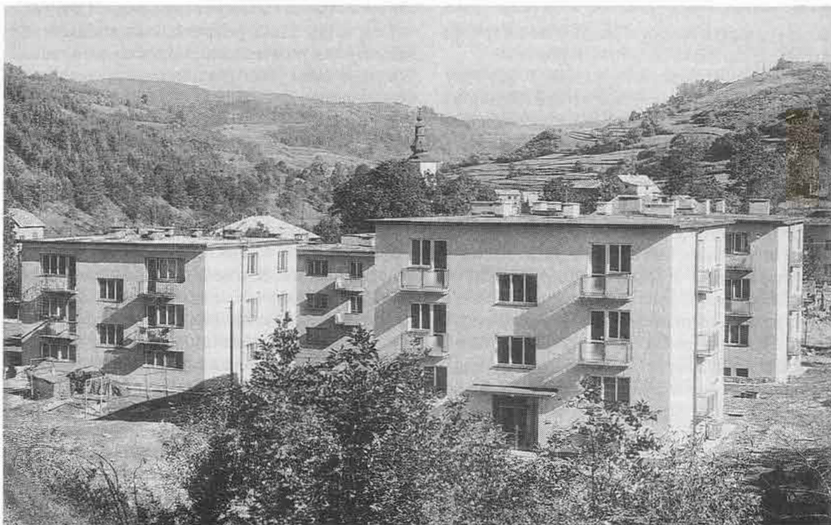
Pohľad na bytovky Jednotného roľníckeho družstva v Terchovej (okr. Žilina), postavené r. 1969.

vedomelý vzťah ku krajine (a to najmä po prechode k nomádneému pastierstvu) išlo o obmedzenosť technických prostriedkov a od stredoveku aj o vplyvy vrchnostenských (štátnych) regulačných opatrení.